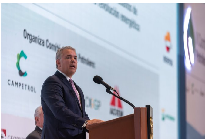
Duque clausuró ayer la II Cumbre de Petróleo y Gas que se desarrolló durante tres días en Bogotá.

Compartir en Facebook Compartir en Twitter G+ P