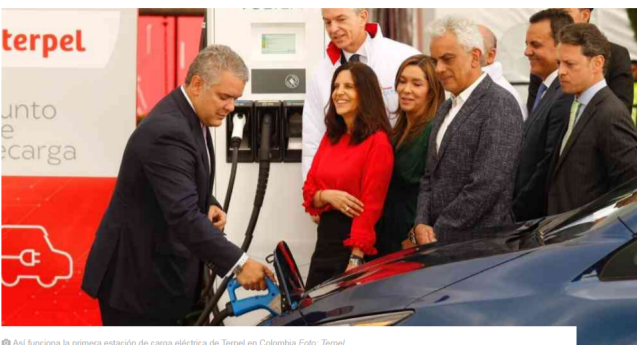
Así funciona la primera estación de carga eléctrica de Terpel en Colombia

Con la marca Voltex, Terpel hace su apuesta por conectar las principales vías del país, fomentando el uso de energía limpia. Duque resaltó los compromisos ambientales del gobierno, de la mano de la empresa privada.