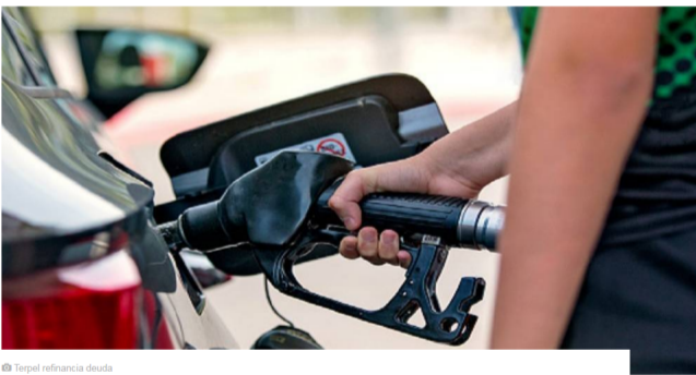
Terpel refinancia deuda

La Organización Terpel S.A tomó la decisión de refinanciar la deuda de 316.037 millones de pesos, que había adquirido en marzo del año pasado, con el fin de adquirir los activos de ExxonMobil en la región. La decisión fue tomada por Junta Directiva en la sesión adelantada a finales del mes de febrero, y con esta se busca disminuir los costos financieros y aumentar el plazo de los créditos de corto plazo. Por medio de un comunicado, la empresa colombiana informó este refinanciamiento no causará impactos negativos en el área comercial, ni en su situación financiera.