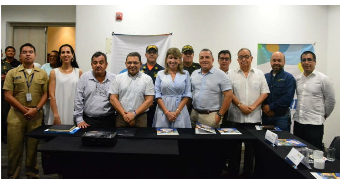
COMITÉ DE CANDIDATURA DE LOS V JUEGOS SURAMERICANOS DE PLAYA 2023. / ALCALDÍA DE SANTA MARTA