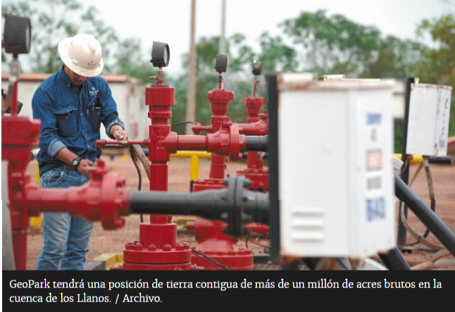
GeoPark tendrá una posición de tierra contigua de más de un millón de acres brutos en la cuenca de los Llanos.

El acuerdo se cerró en US$312 millones y se concretará en diciembre o enero. Amerisur tiene participaciones en campos de los Llanos Orientales y el departamento de Putumayo.