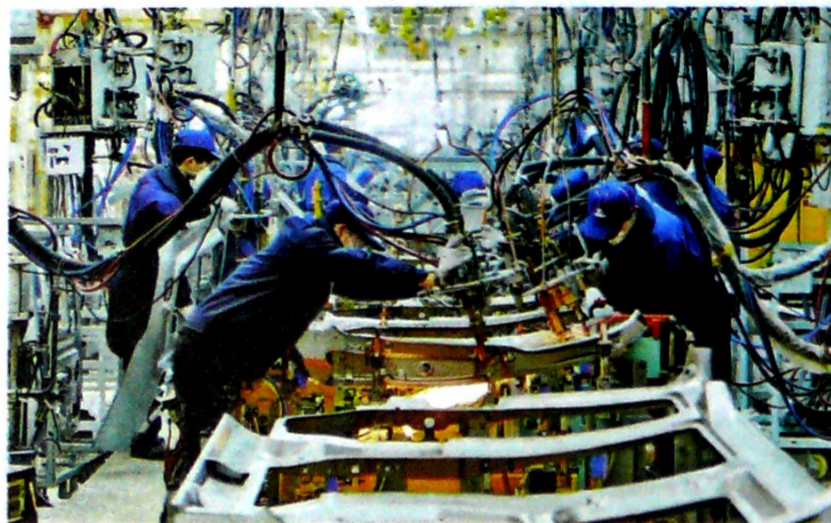
LA INDUSTRIA creció apenas 0,3% en septiembre pero la tendencia es que finalice el año positivamente.

En el periodo enero-septiembre de 2019 frente al mismo periodo de 2018, el departamento que más contribuye a la variación año corrido de la producción nacional es Valle del Cauca con