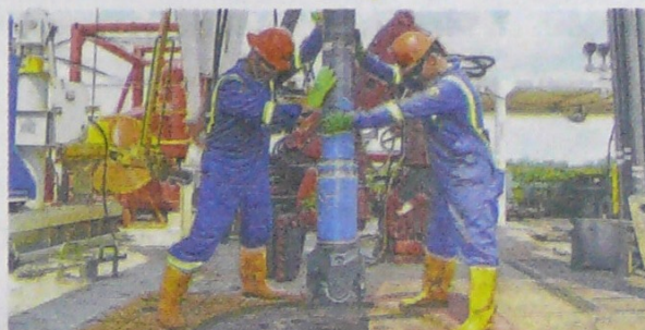
La ANH trabaja en atraer más compañías al país.

CNOOC Petroleum, Vetra E&P, Petróleos Sud Americanos, Interoil Colombia y Lewis Energy buscan bloques. Pág. 12