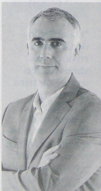
Marcelo Cataldo, presidente de Tigo.

Entre los cambios que hizo el MinTIC está el revelar el valor de reserva, una de las observaciones hecha por los operadores interesados en ese negocio. La empresa espera participar. Pág. 10