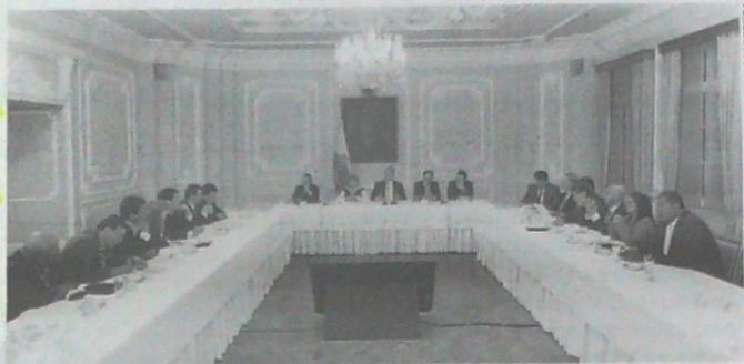
EL PRESIDENTE IVÁN DUQUE encabezó, ayer, la reunión de la Comisión Permanente de Concertación de Políticas Salariales y Laborales en la Casa de Nariño, con participación de ministros, líderes sindicales y dirigentes gremiales.

Por eso, hasta que no termine la limpieza, se mantiene la recomendación de no consumir agua del río Sardinata.