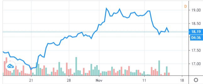
Gráfico de EC por TradingView

Después de completar su última sesión de negociación, Ecopetrol SA (CE) cayó un -0.5%: así es como se veía (a partir del 2019-11-14):