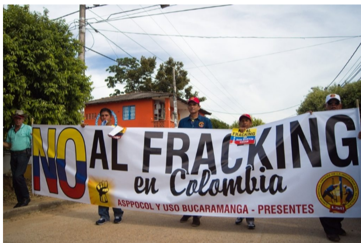
Protestas contra el fracking