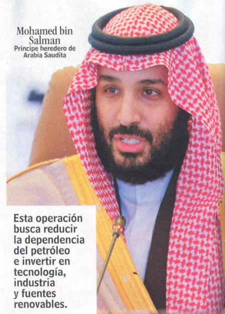
Mohamed bin Salman Príncipe heredero de Arabia Saudita

Esta operación busca reducir la dependencia del petróleo e invertir en tecnología, industria y fuentes renovables.