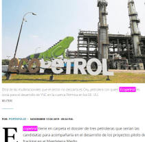
Otra de las multinacionales que el sector no descarta es Oxy, petrolera con quien Ecopetrol es socia para el desarrollo de YNC en la cuenca Pérmica en los EE. UU.