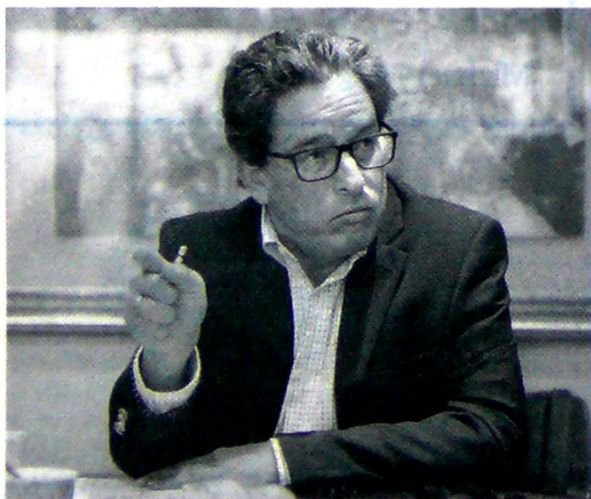
Alberto Carrasquilla, ministro de Hacienda.

A PESAR de la necesidad de aprobar en menos de un mes la reforma tributaria del gobierno de Iván Duque, el Ejecutivo y el Legislativo esperarían una semana más para dar esta discusión.