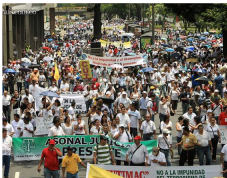
Más de 50 organizaciones sindicales han confirmado asistencia al paro del 21 de noviembre.

Decisiones políticas de gobiernos de diferentes ideologías han generado que la protesta social esté más vigente que nunca en América Latina, y Colombia no se queda atrás.