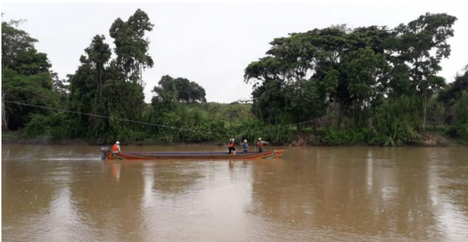
TRABAJADORES DE ECOPEPETROL EN LA ZONA AFECTADA. / ECOPEPETROL