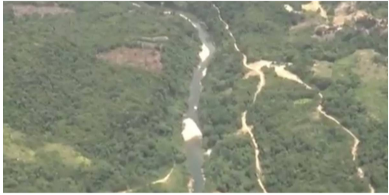
Derrame de petróleo presenta emergencia ambiental en Norte de Santander

Una situación ambiental de alto riesgo se presenta en Norte de Santander, a la altura de las comunidades que recorre el río Sardinata. La emergencia se presentó luego de un escape en el oleoducto Caño Limón Coveñas, tras la instalación de una válvula ilegal.