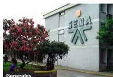
Generales SENA, a debate de control político en el Senado