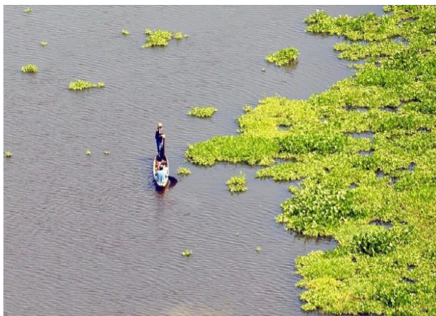
BLU Radio. Ciénaga San Silvestre en Santander.

La ciénaga San Silvestre, que está ubicada en