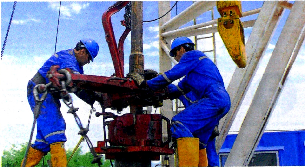
Las petroleras Canacol, Frontera, Geopark, Parex y Gran Tierra también reportaron buenos resultados en el tercer trimestre. CEET

de US$ 126 millones, un 35% mayor al del tercer trimestre de 2018, y la utilidad por barril ( netback ) fue de US$29,61, representando un 15% más que en el mismo periodo del año pasado. Esto se dio gracias a la disminución de los costos de producción del 18% y de