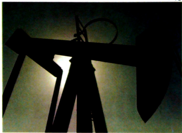
Con el hallazgo, Irán aumenta en un tercio su total de reservas de crudo.

El yacimiento, que tiene 2.400 km 2 de ancho y 80 metros de profundidad, se extiende de Bostan a Omidiyeh, según información oficial iraní.