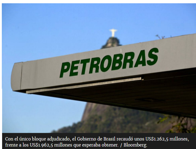
Con el único bloque adjudicado, el Gobierno de Brasil recaudó unos US$1.262,5 millones, frente a los US$1.962,5 millones que esperaba obtener.

La estatal brasileña se quedó con la mayor cantidad de crudo descubierto por cualquier empresa desde la apertura de Irak, después de la segunda Guerra del Golfo.