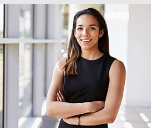
Contador, independizarte es posible con un software gratis. Siigo