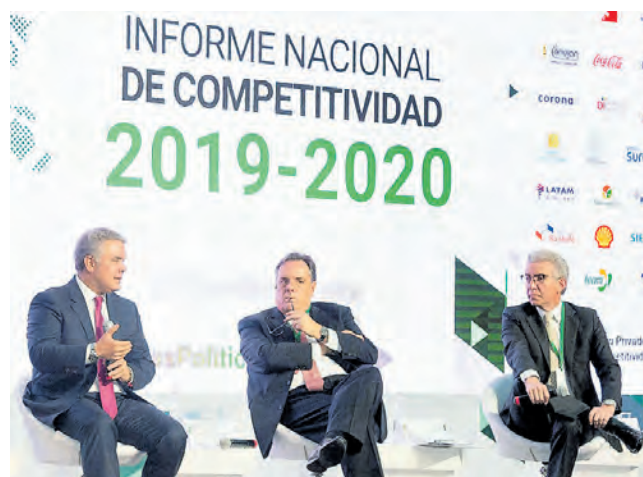
El presidente Iván Duque (izq.) durante un foro.

Con la Resolución 098, la Creg estableció las normas para almacenar y despachar energía de fuentes renovables, como la solar y la eólica. Con esto se garantiza mayor disponibilidad. Pág. 4