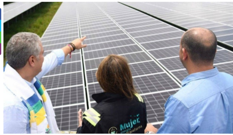
Las emisiones "evitadas" por la generación solar del proyecto de autogeneración en Castilla equivalen a menos de 4 días de extracción de crudo del campo!

Este es un espacio de expresión libre e independiente que refleja exclusivamente los puntos de vista de los autores y no compromete el pensamiento ni la opinión de Las2Orillas.