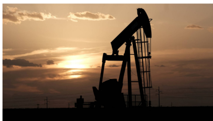
Un pozo de extracción de petróleo en Midland, Texas.

El camino que inició Estados Unidos hace más de una década en busca de la independencia energética acaba de marcar un hito, cuando menos simbólico. La balanza comercial de septiembre refleja un superávit en los intercambios de productos petroleros, el primero desde 1978. La producción doméstica de esta fuente energética se disparó gracias a las nuevas técnicas de extracción como la fracturación hidráulica.