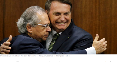
El ministro de Economía, Paulo Guedes, y el presidente de Brasil, Jair Bolsonaro, en el Congreso.

Son nueve campos ubicados en aguas ultraprofundas, debajo de una espesa capa de sal.