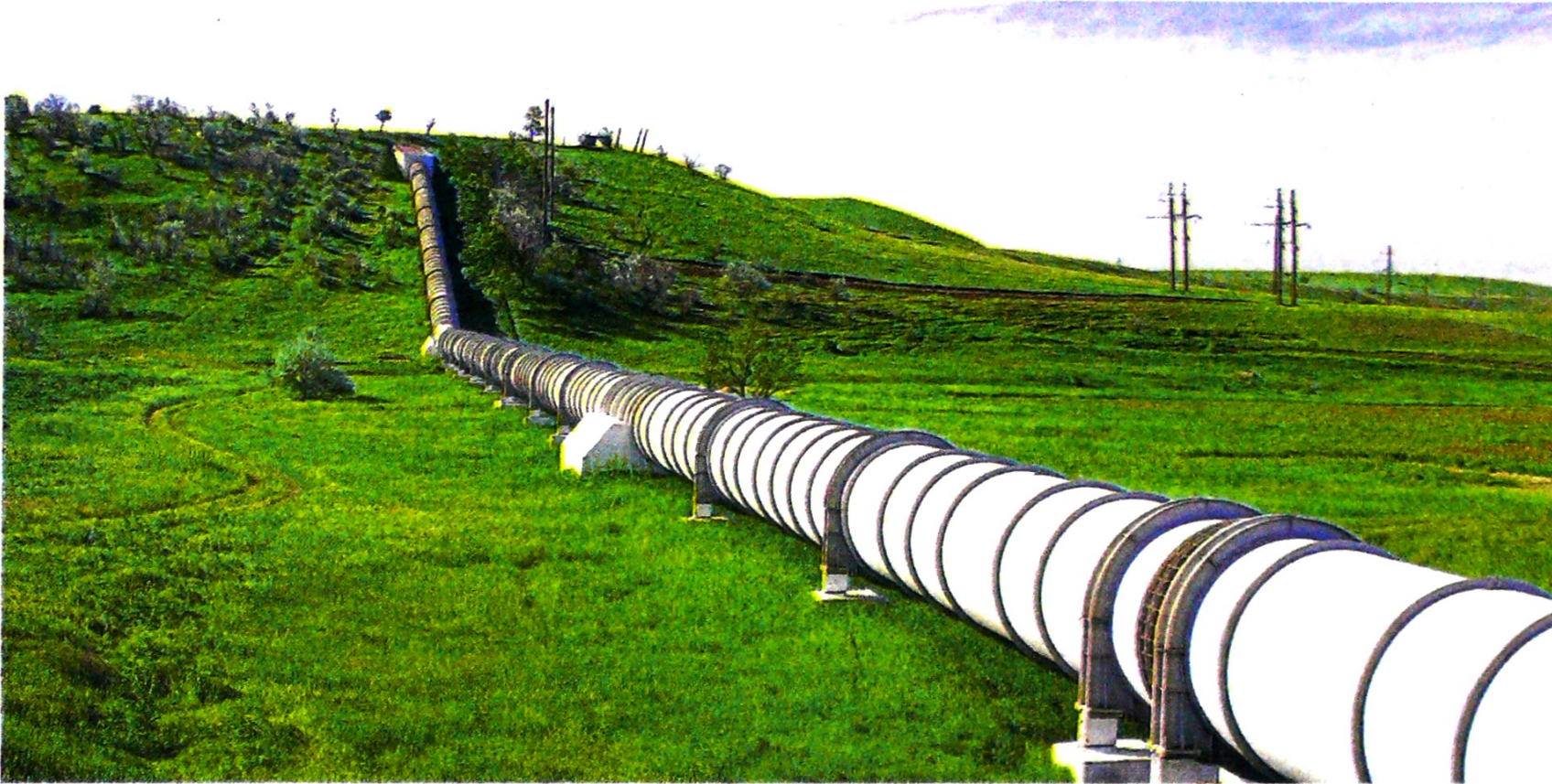
"El transporte de crudos por la red de oleoductos en el país subió de 829.000 a 881.000 barriles por día", Felipe Bayón Pardo, presidente Ecopetrol.