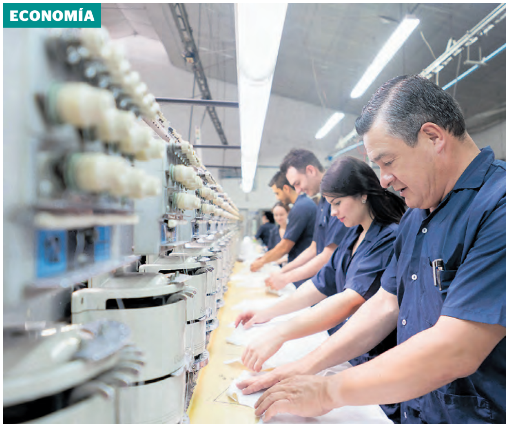
La existencia de cinco demandas ante la Corte no frenará la imposición de las tarifas al sector.