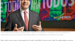
© presidente de Ecopetrol, Felipe Bayón, destaca los positivos resultados de su compañía, en momentos en que los precios internacionales han mantenido su tendencia a la baja.

Se trata de una gran noticia para el fisco, que en las últimas semanas había tenido algunos tropiezos con el hundimiento de la Ley de Financiamiento y las sombras que se ciernen sobre la aprobación de la nueva reforma tributaria.