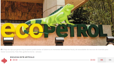
© El flujo de caja que genera hoy Ecopetrol podría tentar al Gobierno en momentos de estrechez fiscal y de necesidades de recursos de inversión para mover la economía. Foto: foto: guillermo torres - semana

Ecopetrol acaba de hacer un movimiento clave en la búsqueda de reservas y en la diversificación de su portafolio. Se alió con OXY y desarrollará proyectos de fracking en Estados Unidos, lo que le significará invertir 1.500 millones de dólares. ¿Qué implica esta medida?