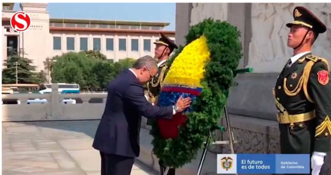
El ramo chino de Duque que molestó al uribismo

El viaje a China del presidente Iván Duque no ha estado exento de críticas, pero esta vez la molestia es dentro del propio uribismo por la ofrenda floral, del tricolor nacional, que Duque presentó ante el Monumento a los Héroes de la Revolución comunista de Mao-Tse Tung.