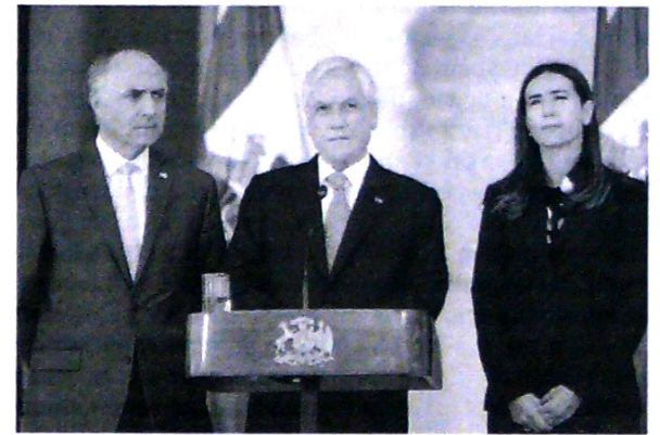
El Gobierno de Piñera se reunió con la oposición.

(EFE) El presidente sirio, Bashar al Asad, aseguró que el acuerdo que Damasco selló con los kurdos para desplegar las tropas del Gobierno en las zonas bajo su control es "bueno" y servirá para que se recupere el control de todo el territorio paulatinamente.