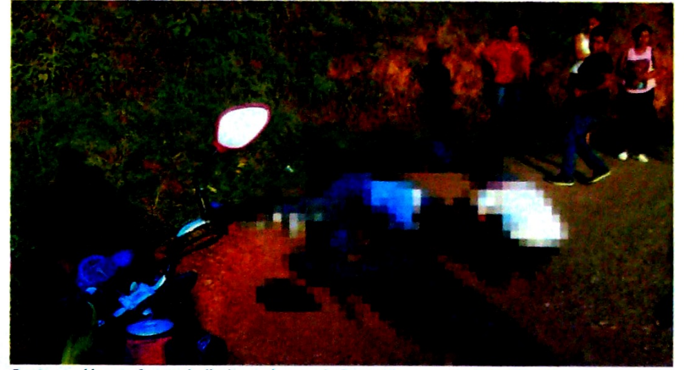
Cuatro cadáveres fueron hallados en la vereda Santa Elena, en Corinto (Cauca).