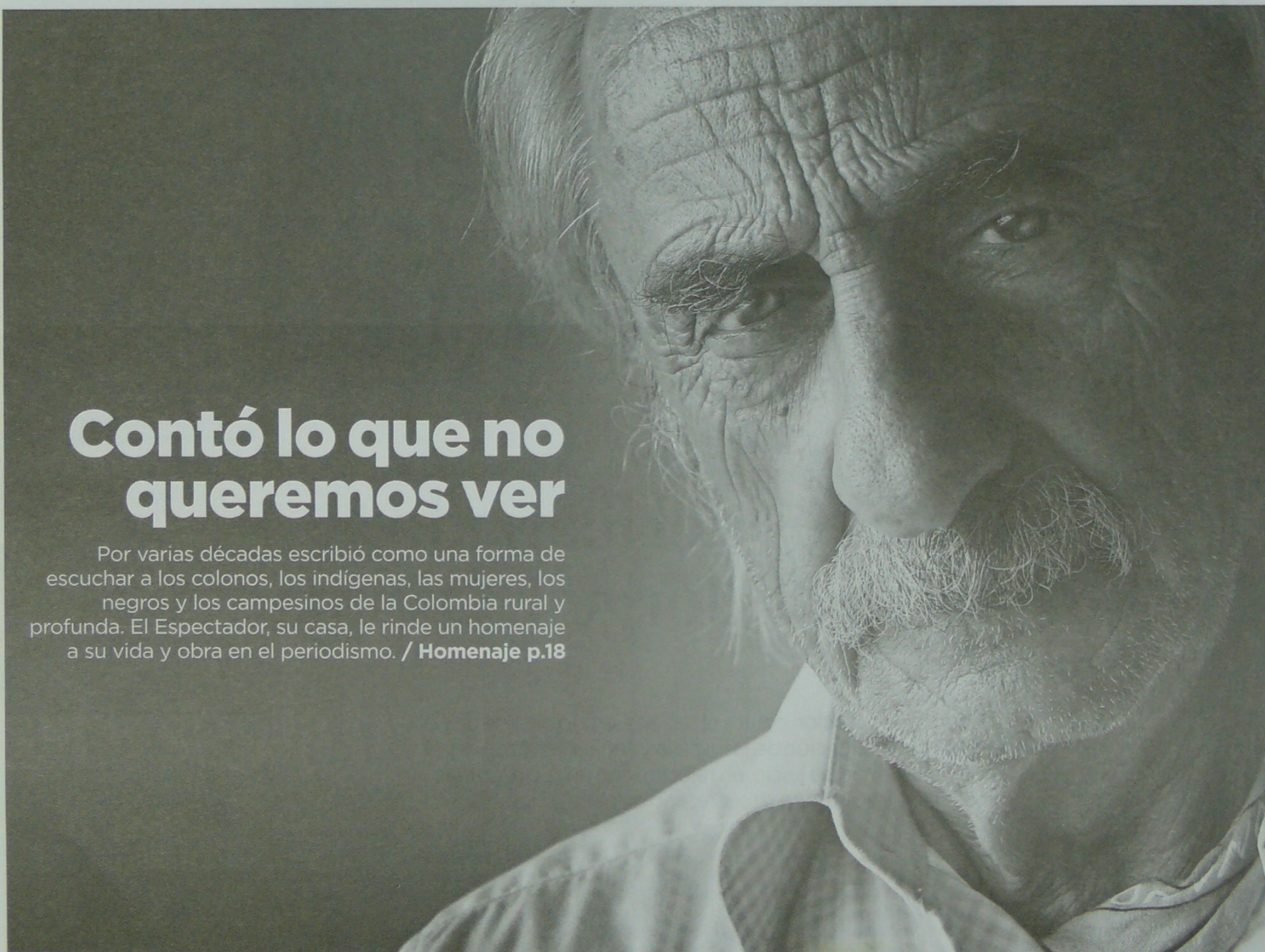
Alfredo Molano Bravo falleció ayer en horas de la madrugada. Por más de 30 años fue columnista de El Espectador. / Nelson Sierra Gutiérrez

Por varias décadas escribió como una forma de escuchar a los colonos, los indígenas, las mujeres, los negros y los campesinos de la Colombia rural y profunda. El Espectador, su casa, le rinde un homenaje a su vida y obra en el periodismo. / Homenaje p.18