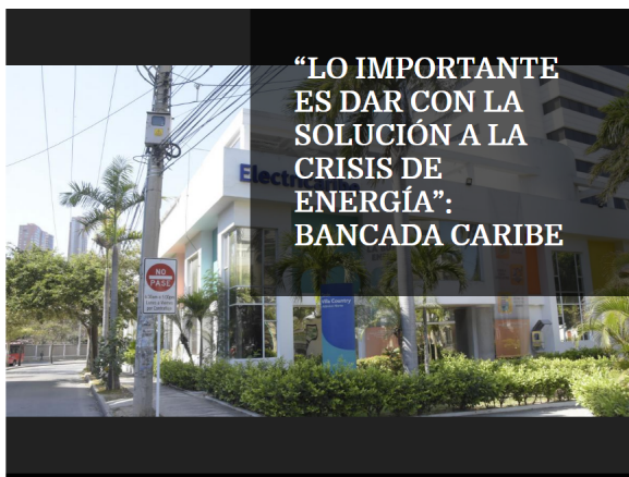
Fachada de una de las sedes de Electricaribe, ubicada en el norte de Barranquilla.