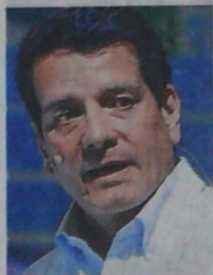
Felipe Bayón, presidente de Ecopetrol.

No descartó la posibilidad de realizar alianzas estratégicas con otras compañías, sobre todo con aquellas que han hecho este tipo de operaciones de manera exitosa, responsable,