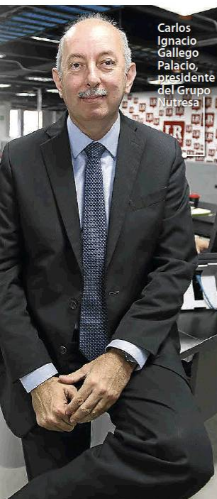
Carlos Ignacio Gallego Palacio, presidente del Grupo Nutresa