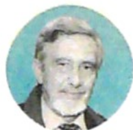
GUILLERMO PERRY Exministro de Hacienda y Minas y Energía