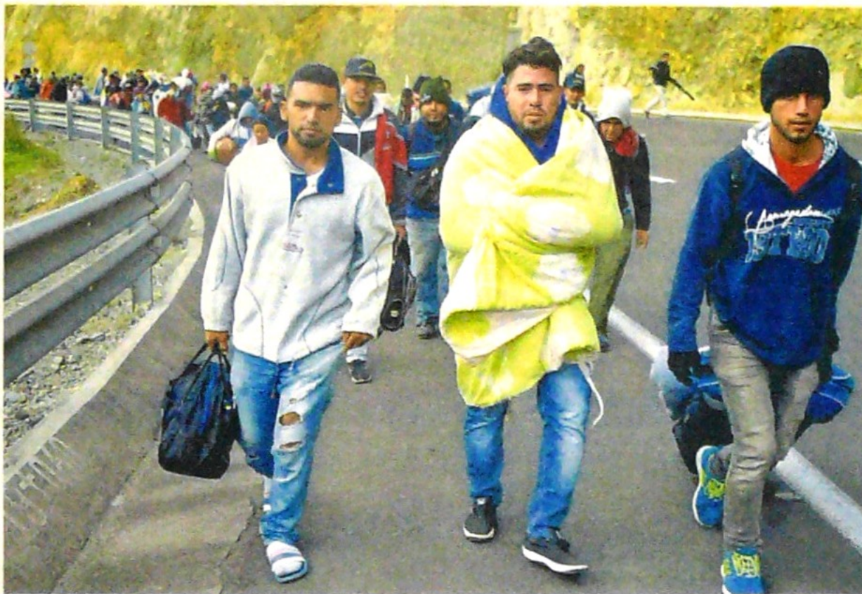
Se estima que en Colombia hay alrededor de 1,2 millones de migrantes venezolanos que demandan ayuda.

Aunque algunos analistas económicos ven con buenos ojos la flexibilización de la regla fiscal, otros consideran que esta es una disculpa para no cumplirla, lo que sería mal visto por las calificadoras internacionales, que en las próximas semanas presentarán sus evaluaciones sobre el país.