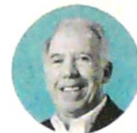
SERGIO CLAVIJO Presidente de Anif Centro de Estudios Económicos

En medio de la discusión sobre el tema, algunos creen que uno de los problemas de acogerse a la cláusula de escape es que si bien el costo de la migración puede ser temporal, es necesario adoptar soluciones perdurables frente a los problemas fiscales. Aun así, también hay quienes dicen que efectivamente el escape sería por una sola vez, y que no habría problema en reducir la meta de déficit del 2019.