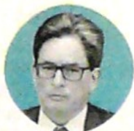
ALBERTO CARRASQUILLA Ministro de Hacienda