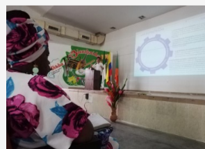
Antioquia y Eje Cafetero, listos para construir verdad junto a la CEV