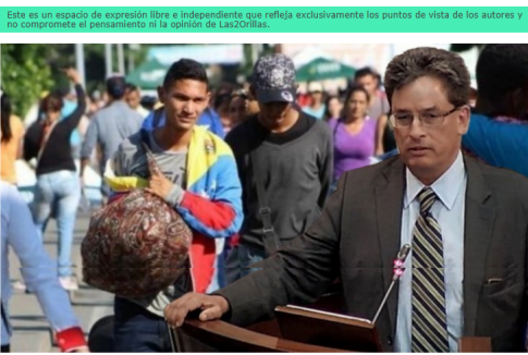
Los venezolanos les dieron el papayazo perfecto a todos, al Gobierno en general y a Carrasquilla en particular, al FMI y a la OCDE.

Por: Cecilia López Montaño | Marzo 26, 2019