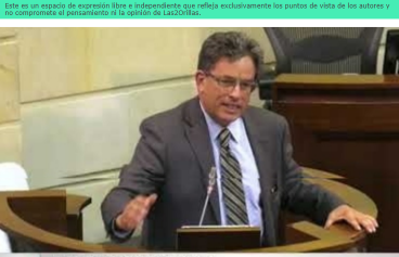
El PND contiene una reforma laboral y pensional que significa contratos por horas, por debajo del salario mínimo y con un ahorro para el empresario hasta de un 36 % de los costos laborales y por tal una mayor precarización laboral

Por: Fabio Arias Giraldo | Marzo 26, 2019