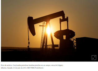
Foto de archivo. Una bomba petrolera, bombas petroleras en un campo, cerca de Calgary, Alberta, Canadá. 21 de julio de 2014.

LONDRES (Reuters) - Los precios del petróleo se negociaban estables el lunes, en medio de la preocupación por una fuerte desaceleración económica que limitaba los efectos en el mercado de suministros ajustados por los recortes de la OPEP y las sanciones de Estados Unidos a Irán y Venezuela.