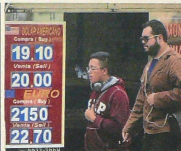
El cambio en Argentina se acerca a los 43 pesos por dólar.

Por su parte, la moneda local en la franja informal de cambios perdió un 0,36