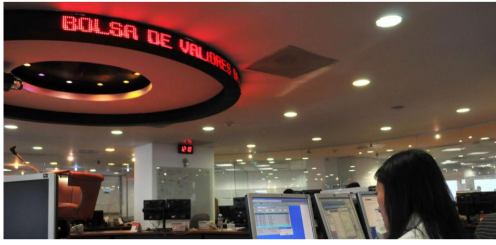
La plaza bursátil colombiana se anticipó a un probable mayor crecimiento en el 2019.

Los riesgos locales pueden estar por el lado del aumento del desempleo, que afectaría el consumo.