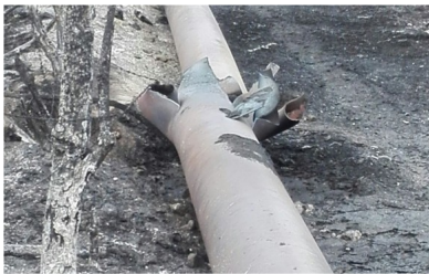
Ecopetrol aún no estima el daño ambiental que produjo el atentado al oleoducto.

ATENTADOS COLOMBIA CONTAMINACIÓN AMBIENTAL HIDROCARBUROS MEDIO AMBIENTE NARIÑO ORDEN PÚBLICO PETRÓLEO