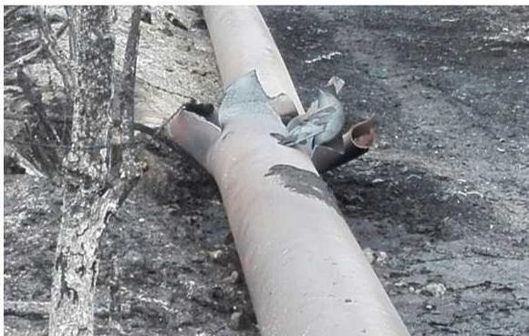
Ecopetrol aún no estima el daño ambiental que produjo el atentado al oleoducto.

ATENTADOS COLOMBIA CONTAMINACIÓN AMBIENTAL HIDROCARBUROS MEDIO AMBIENTE NARIÑO ORDEN PÚBLICO PETRÓLEO