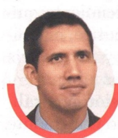
Juan Guaidó Presidente interino de Venezuela

Aunque ya existen unos cálculos preliminares del prolongado apagón —especialmente de empresas y comercios que fueron saqueadas durante el