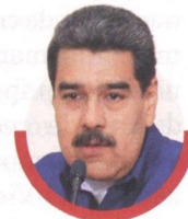
Nicolás Maduro Presidente de Venezuela

colapso— es difícil cuantificar la magnitud total. El apagón ocurrió un par de días después del asueto por Carnaval. Por eso el presidente de Fedecámaras, Carlos Larrazábal, asegura que para el país se habrían sumado unos 15 días sin actividad productiva.