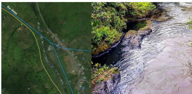
Fotografía de derrame de crudo en el Río Güiza.

RELACIONADOS: NARIÑO | ECOPETROL | OLEODUCTO