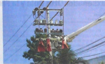
La Costa requiere más inversiones en infraestructura eléctrica.

José Camilo Manzur, presidente ejecutivo de ese grupo, fue claro en precisar que "nosotros -Asocodis- respaldamos y valoramos todo tipo de solución estructural y que sea definitiva, para de una vez por siempre solucionar el problema de energía de la Costa Caribe colombiana. En ese contexto, desde diciembre pasado, le enviamos al presidente Duque una serie de propuestas, con miras a contribuir a esa solución definitiva. No obstante ello, nos pare-