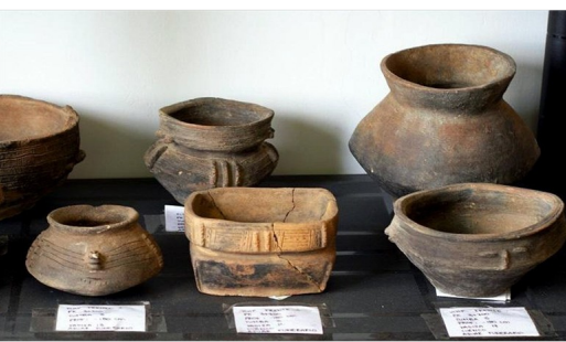
A lo largo de los 55 kilómetros del trazado, entre los municipios de Chinchiná y Pereira, se identificaron 124 sitios, de los cuales 78 fueron excavados e hicieron parte del rescate arqueológico.

Así lo reveló Ecopetrol a través de un comunicado e indicó que este material recuperado permite describir una secuencia de ocupación de unos 2.000 años.