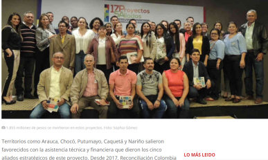
1.355 millones de pesos se invirtieron en estos proyectos.

La corporación fortaleció las iniciativas del campesinado colombiano en once departamentos golpeados por el conflicto armado. Las propuestas, lideradas en su mayoría por mujeres, ofrecen 1.400 empleos directos.