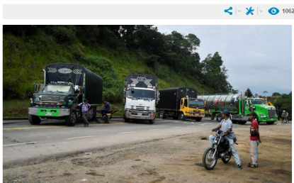
Camiones bloquean la vía Panamericana en Colombia durante una protesta indígena.