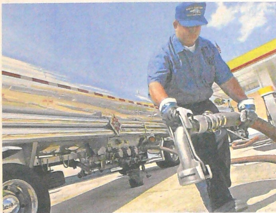
Al menos 150.000 galones de diésel y 140.000 de GLP al día serán entregados por Ecuador.

"Un mecanismo que nos permita obtener el suministro de al menos 150.000 galones diarios de diésel, 235.000 galones al día de gasolina motor corriente y de 140.000 galones por jornada de GLP, durante los